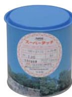
内装 (外径100mm 20枚入り)