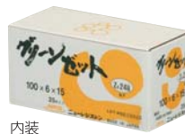
内装 (外径100mm 25枚入り)