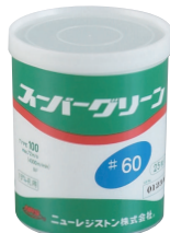
内装 (外径100mm 25枚入り)