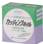
内装 (外径107mm 10枚入り)