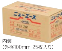
内装 (外径100mm 25枚入り)