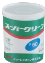
内装 (外径100mm 25枚入り)