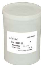
内装 (外径100mm 25枚入り)