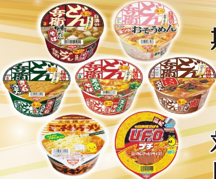
ミニカップめん (全7種)